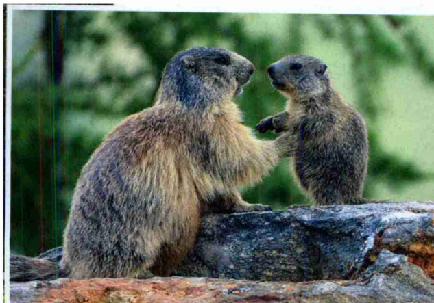
SCHNÜGEL Murmeltiere sind drollig und begeistern Kinder und Erwachsene gleichermaßen.