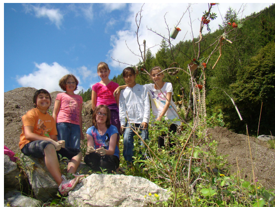
« L'arbre improbable » se compose d'une multitude d'objets trouvés dans la carrière attenante par un groupe d'enfants.

genres qui s'y trouvaient afin de construire des sculptures impressionnantes. Avec l'artiste Greg Corthay, les enfants répartis en deux groupes ont laissé cours à leur imagination pour créer des œuvres à la fois belles et originales.