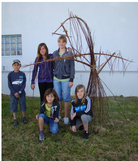
Un nouvel oiseau a élu domicile aux Ruinettes.

Côtoyer une artiste de renom pendant deux journées et créer une œuvre originale sur ses conseils avisés, tel était le programme réservé à la vingtaine d'enfants inscrits pour cette activité artistique. En compagnie de la sculptrice Kiki Thompson, les participants ont eu l'occasion de s'essayer à la fabrication de pièces monumentales, à l'aide de matériaux divers. L'exposition des quatre sculptures devant le restaurant des Ruinettes a fait l'objet d'un petit vernissage ouvert aux parents et les œuvres sont restées visibles durant tout l'été.