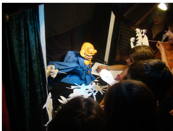
La marionnette Igor a fait son effet auprès des enfants.