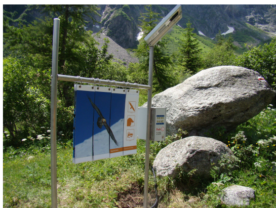
Le poste 9 du sentier didactique de La Fouly est consacré aux animaux de la région et à certaines de leurs caractéristiques.

Les jeux en 3D ont eu particulièrement la cote, notamment le poste des cris d'animaux qui requérait de la concentration et certaines connaissances en matière de cris d'animaux de la région. Des visiteurs sont même retournés sur le site pour vérifier leurs réponses !