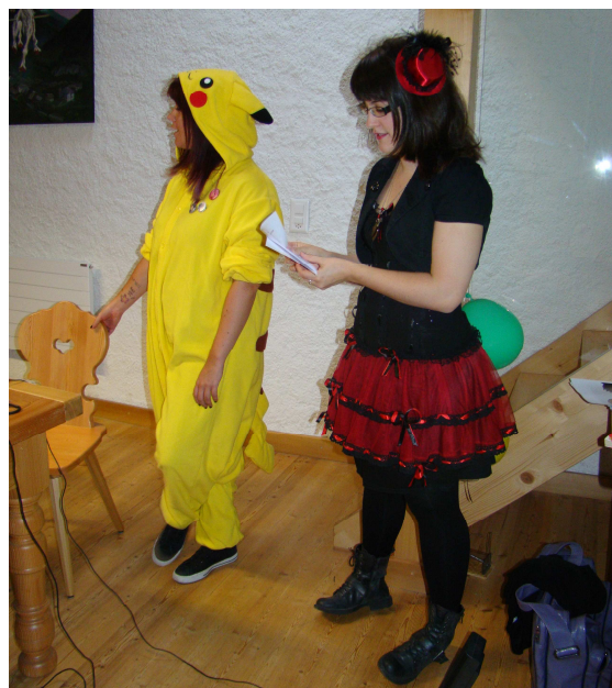
Pikachu et Lolita ont passé par Sembrancher.