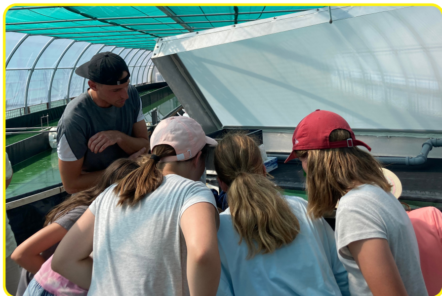
Passeport Vacances d'été 2023 - Visite des cultures de spiruline