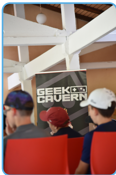
Passeport Vacances d'été 2023 Journée autour des jeux vidéo