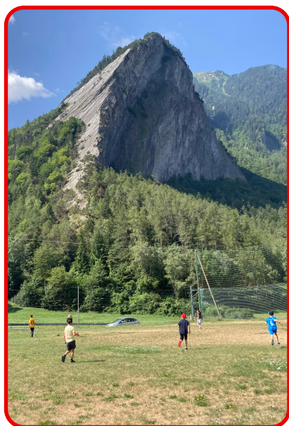
Passeport Vacances d'été 2023 Moment détente