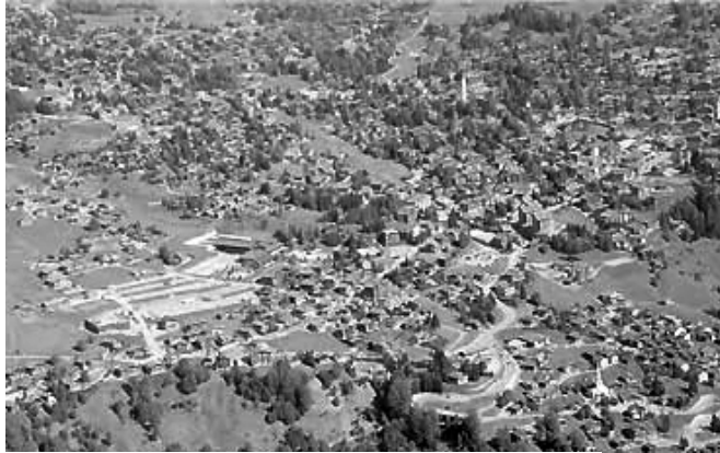
Verbier, une économie touristique