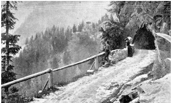
Sur la route de La Forclaz en direction de Trient

Faire une recherche documentaire sur les premiers touristes de la région (cartes postales, dépliants touristiques, peintures et dessins, récits de voyage, livre de passage d'hôtels et de cabanes, littérature classique, journal de guide de montagne...). Interviewer les personnes âgées du village en récoltant des histoires, des anecdotes mettant en scène ces touristes avec les villageois.